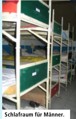
Schlafraum für Männer.