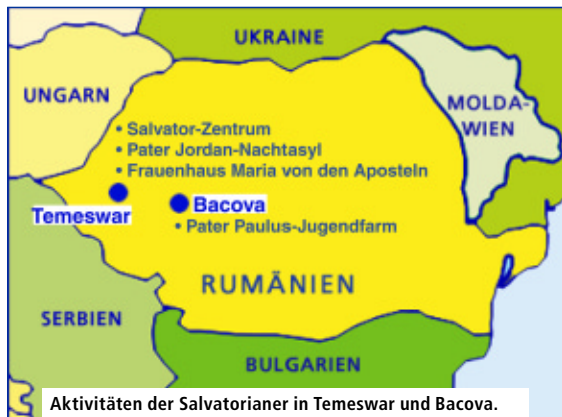
Aktivitäten der Salvatorianer in Temeswar und Bacova.