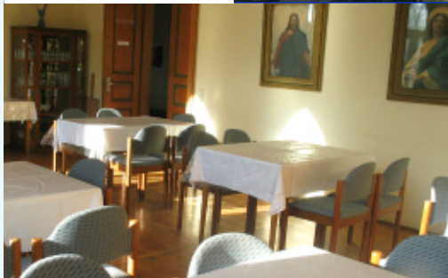
Speiseraum für Gäste.