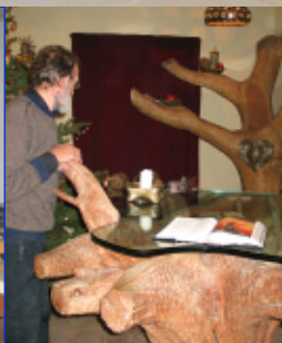
Hauskapelle mit Touch.