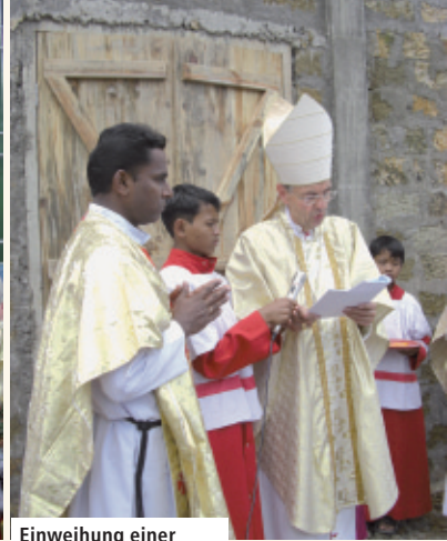
Einweihung einer Dorfkirche