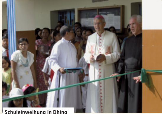
Schuleinweihung in Dhing

20. 8. Dhing: Am Donnerstag war ein großes Fest in der Schule in Dhing vorbereitet, der Schule, die von P. Philipp ins Leben gerufen wurde. Bischof Schick weihte das neue Schulgebäude ein, in dem teilweise schon unterrichtet wurde. Es folgte eine große Festfeier mit ausgiebigen Begrüßungszeremonien. Klein und groß gaben ihr Bestes mit Reigen und Tänzen. Ich trug bei diesen Feierlichkeiten meinen schwarzen Habit. Mir wurde dabei überdeutlich, wie angenehm und angebracht der leichte weiße Habit der indischen Mitbrüder in einem solchen Klima ist. Auch in dieser Region gibt es kaum Christen. Aber es ist offenbar ein gangbarer Weg, eine Pfarrei in Verbund mit der Schule aufzubauen.