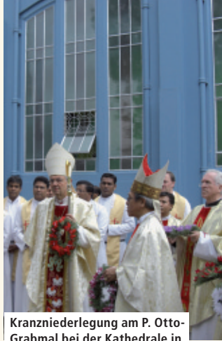
Kranzniederlegung am P. Otto- Grabmal bei der Kathedrale in Shillong