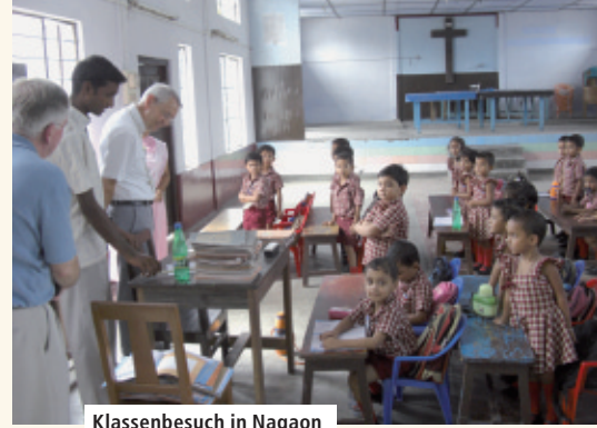
Klassenbesuch in Nagaon