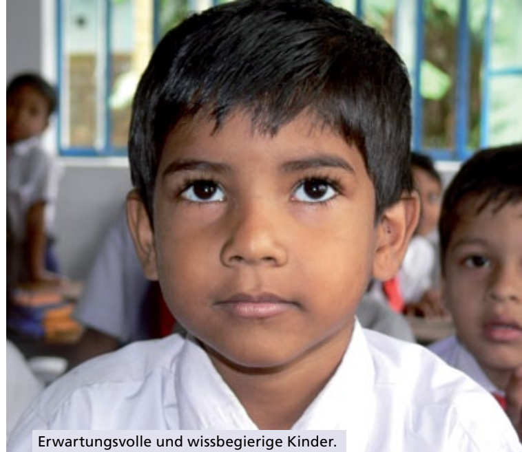
Erwartungsvolle und wissbegierige Kinder.