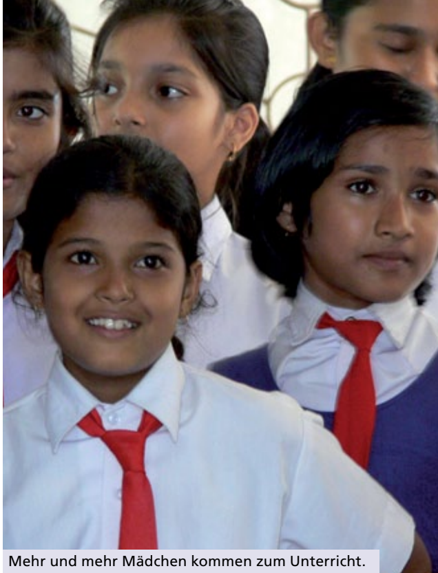
Mehr und mehr Mädchen kommen zum Unterricht.

Bildung ist der Schlüssel zu einer nachhaltigen menschlichen und gesellschaftlichen Entwicklung. Bildung befähigt zur Lösung der fundamentalen Probleme, denen die Bewohner dieses Landstrichs gegenüber stehen, wie Armut, Arbeitslosigkeit und Chancenlosigkeit. Salvatorianische Schulen sind in Indien sehr angesehen wegen des hohen Standards des Unterrichts. Diese Qualität können wir nur erreichen, weil unser Orden auf lokaler, nationaler und internationaler Ebene dafür einsteht. Unsere Schulen arbeiten nachhaltig, weil sie von einer weltweiten Gemeinschaft mitgetragen werden.